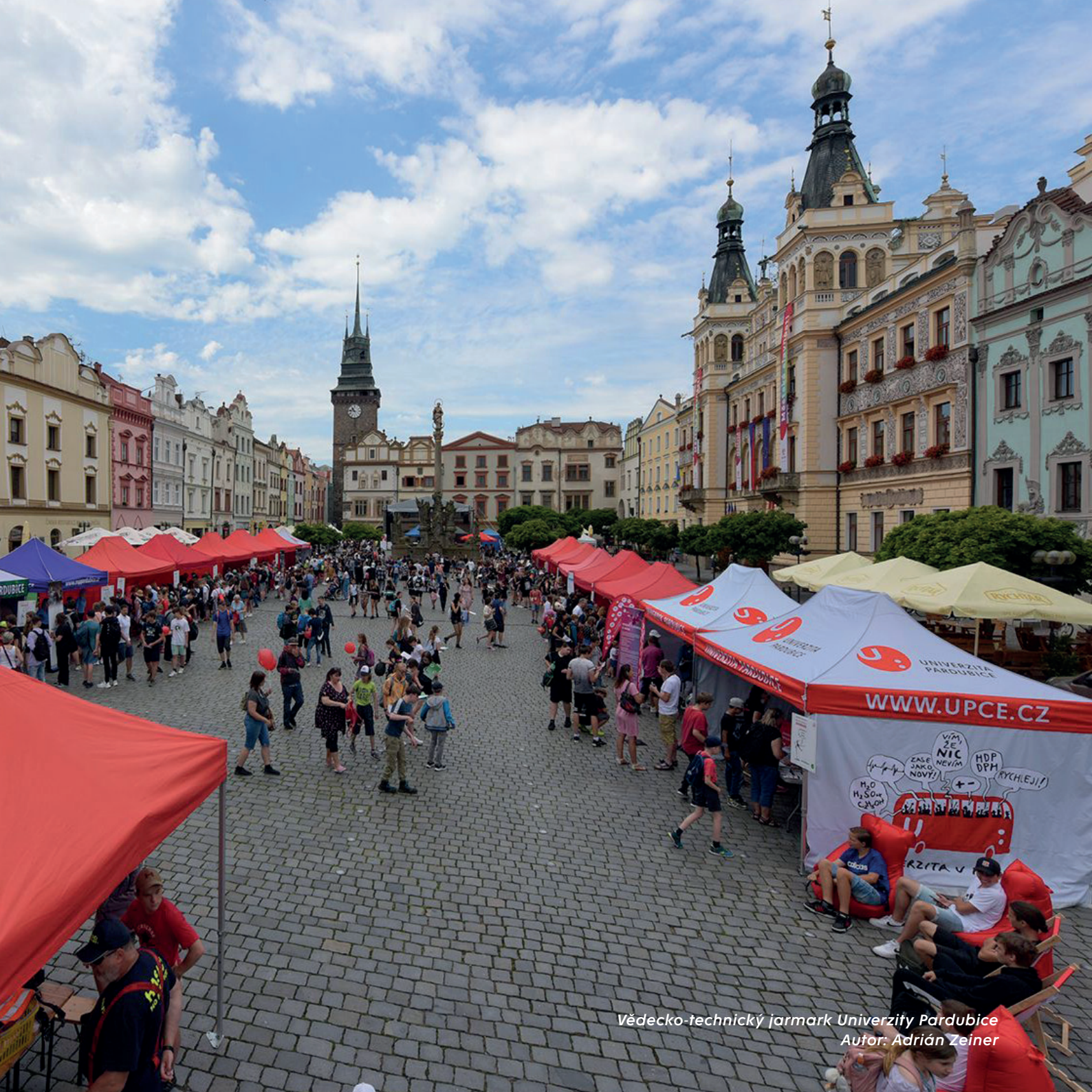
Vědecko-technický jarmark Univerzity Pardubice