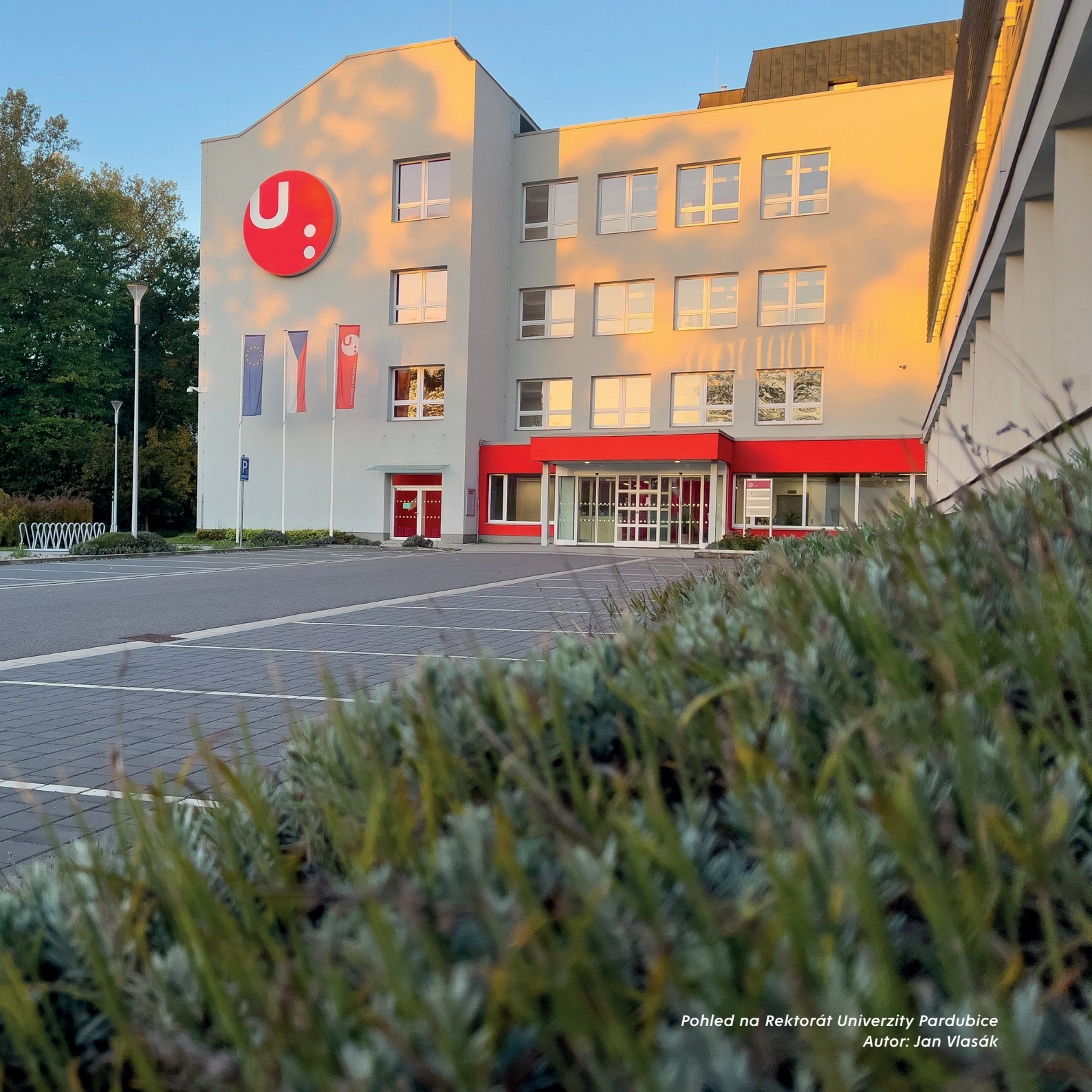
Pohled na Rektorát Univerzity Pardubice