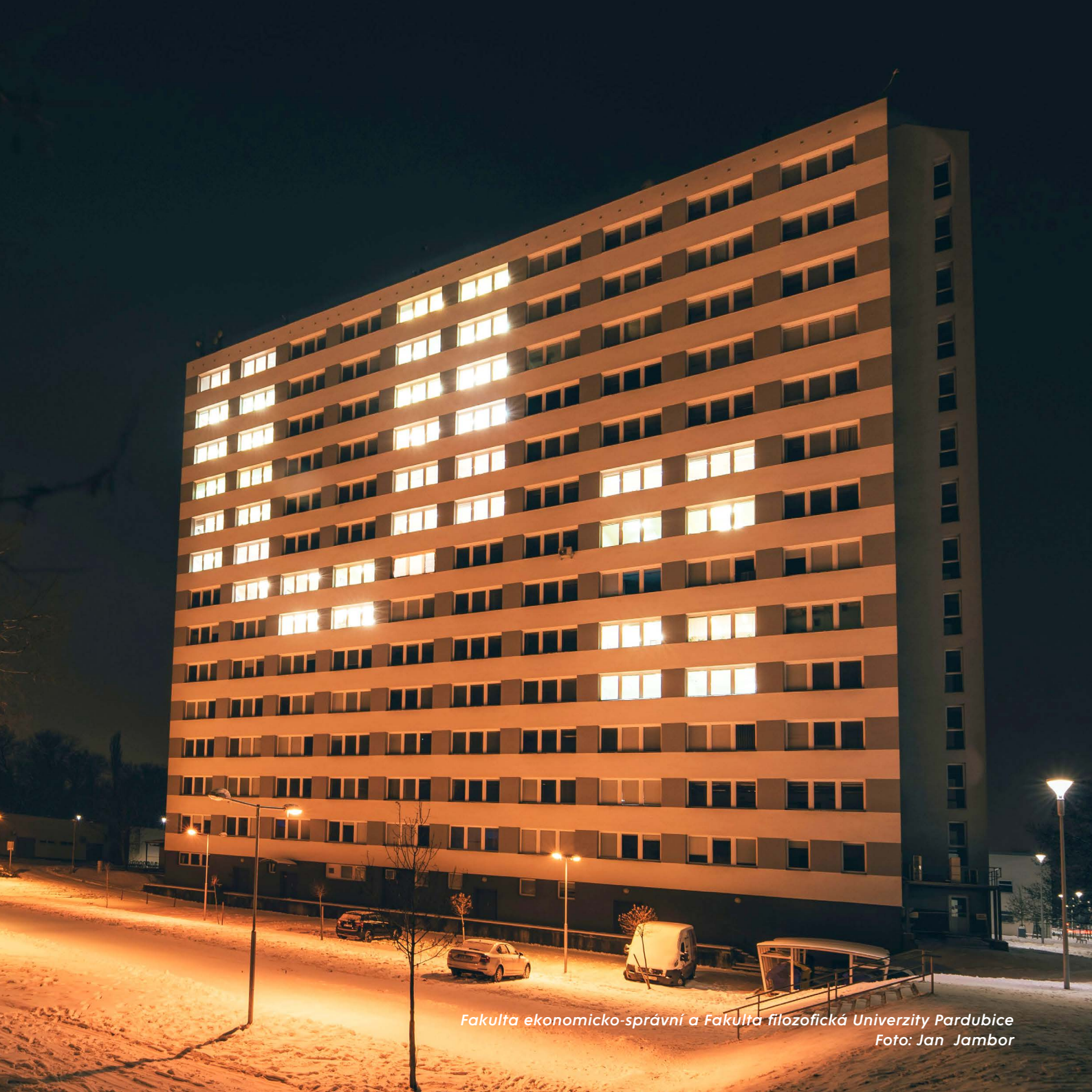
Fakulta ekonomicko-správní a Fakulta filozofická Univerzity Pardubice