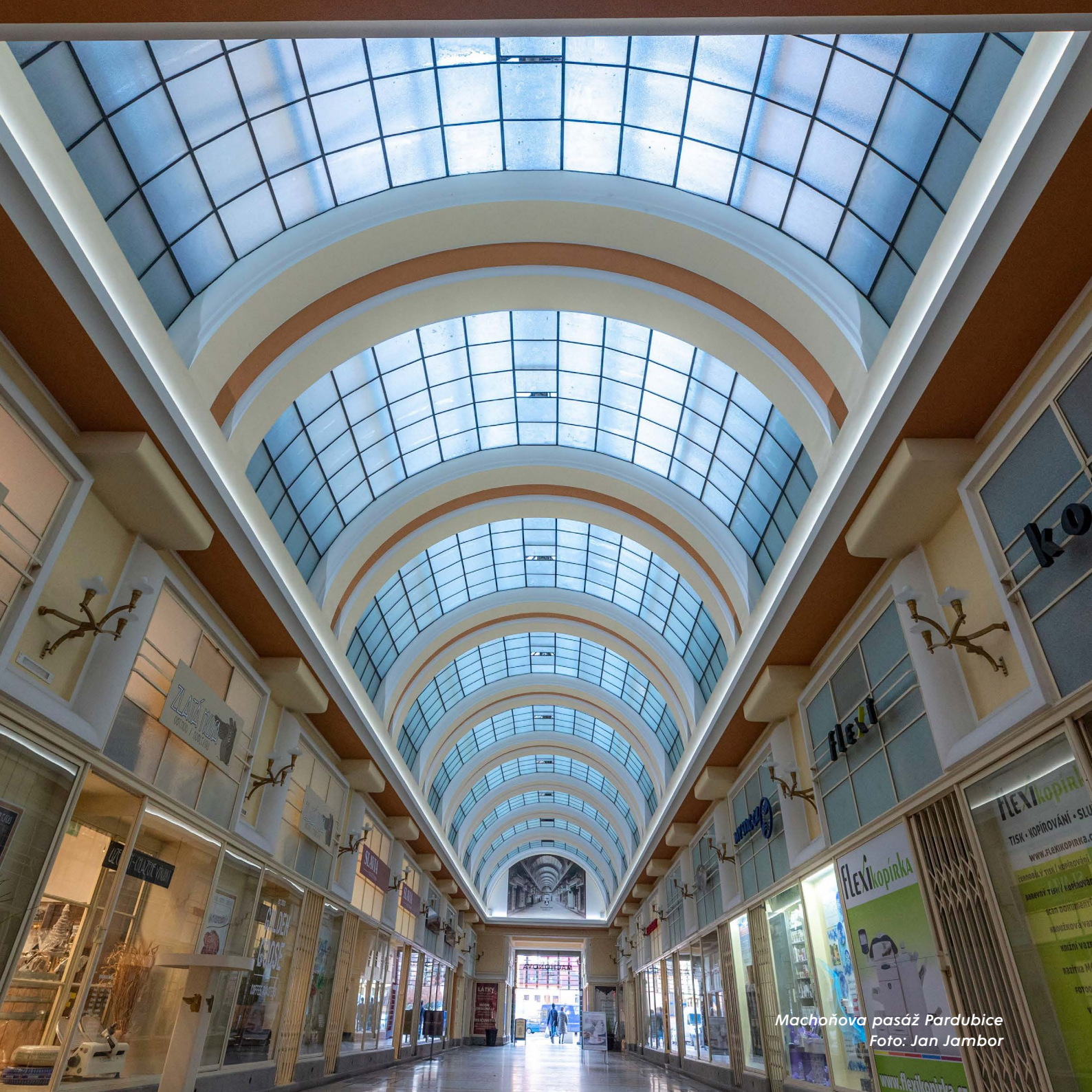
Machoňova pasáž Pardubice