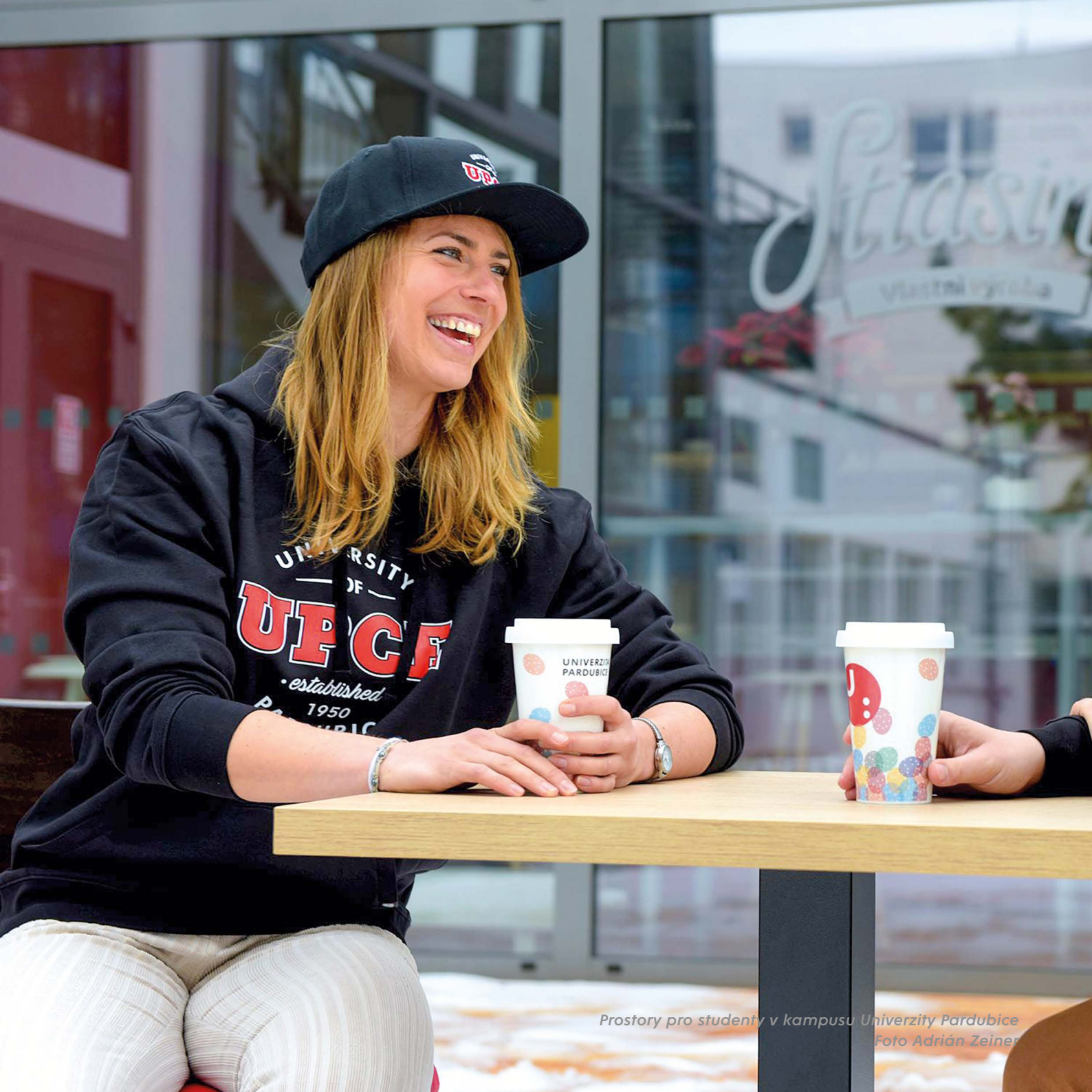
Prostory pro studenty v kampusu Univerzity Pardubice