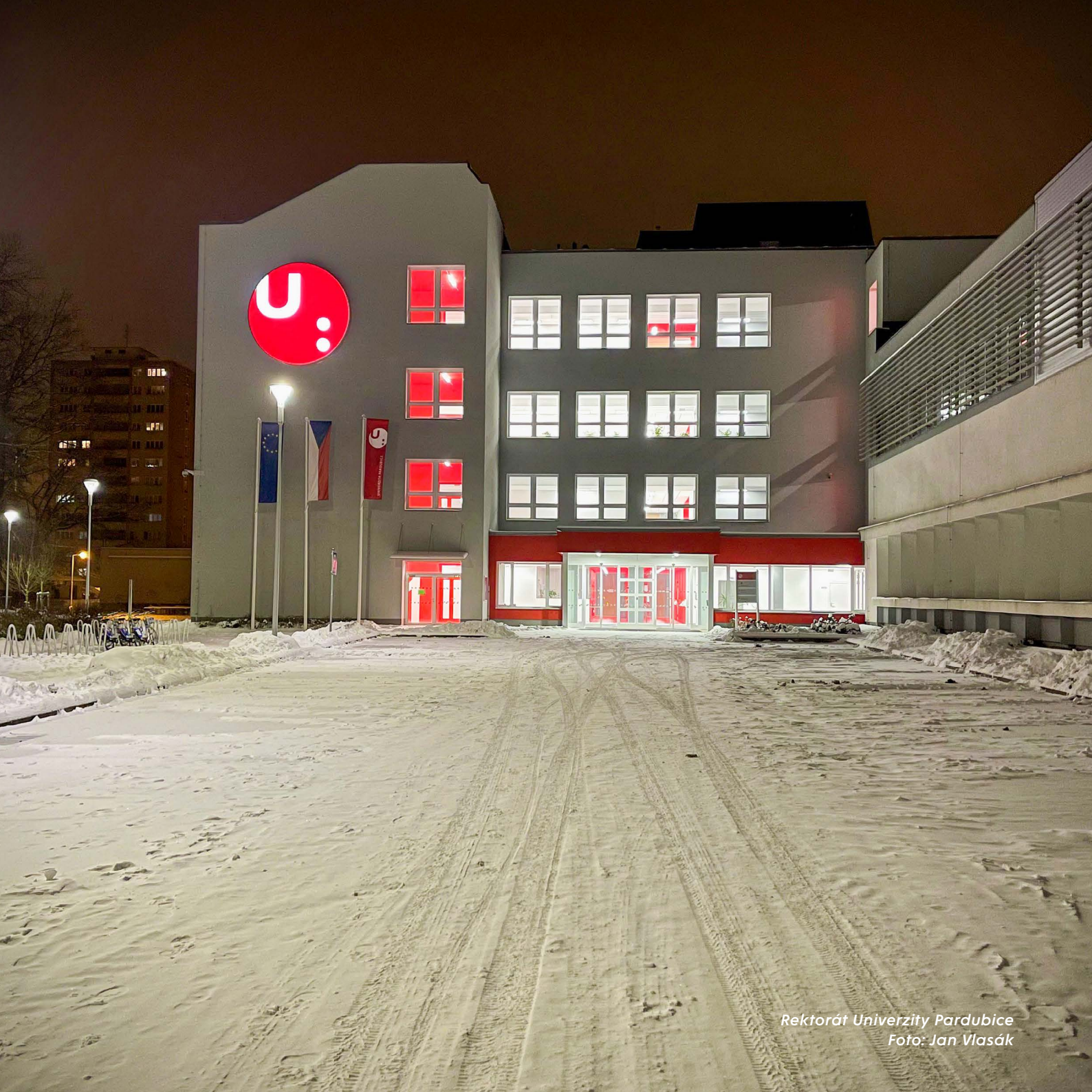
Rektorát Univerzity Pardubice