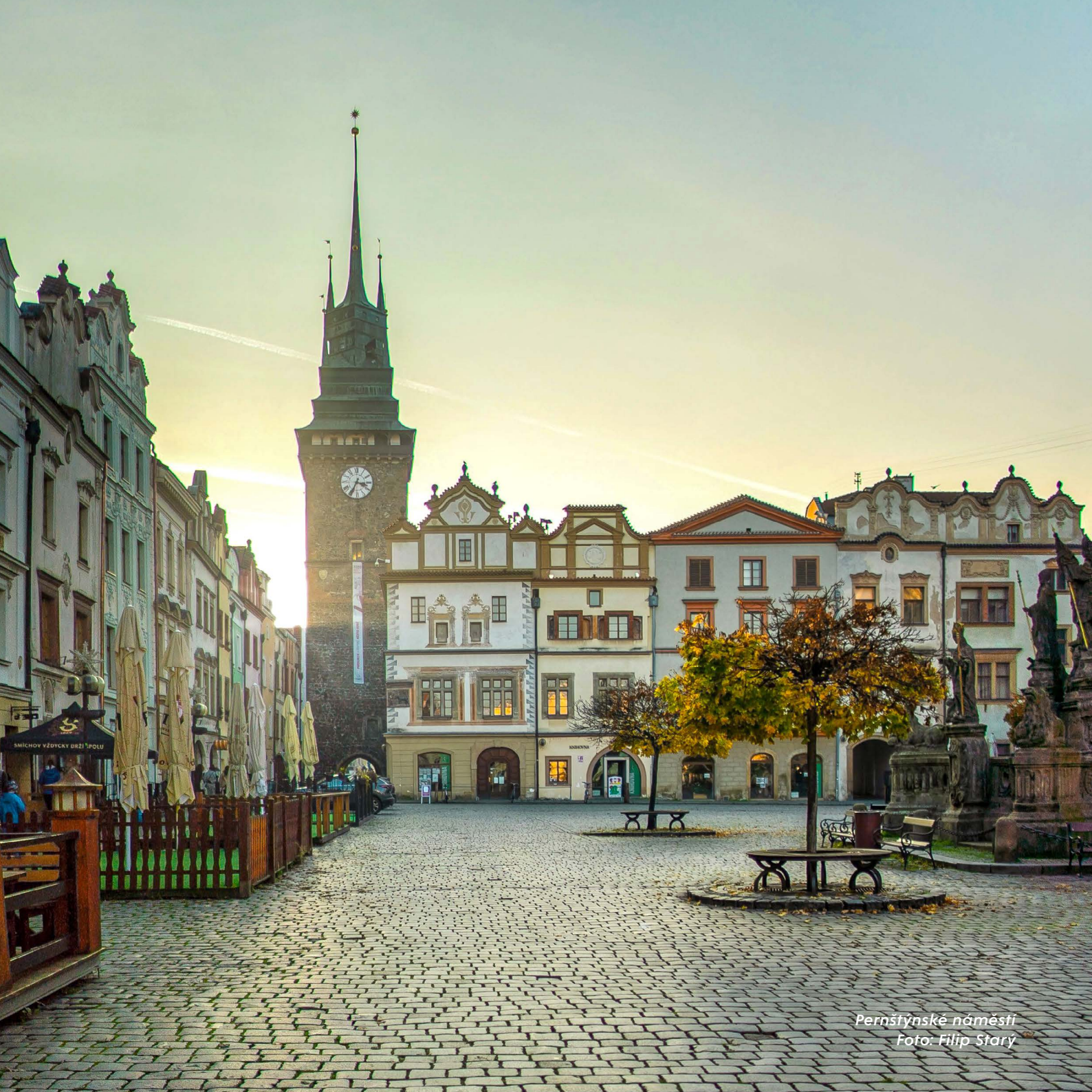
Pernštýnské náměstí